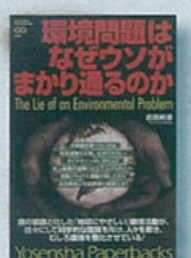
洋泉社 952円(税抜き) ISBN978-4-86248-122-1

地球環境問題の伝道師」として注目された。2007年10月にはノーベル平和賞を受賞している。一方、「環境活動を錦の御旗と化すことで社会は合理的な判断を失っている」と主張するのは『環境問題はなぜウソがまかり通るのか』(丸善丸の内本店総合26位)。